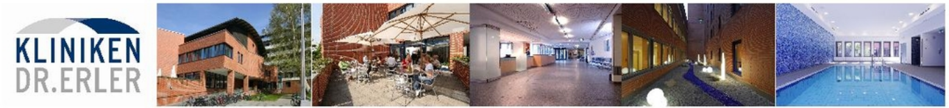
Abbildung: Bilderreihe der Kliniken Dr. Erler gGmbH

Sehr geehrte Damen und Herren, liebe Patientinnen und Patienten,